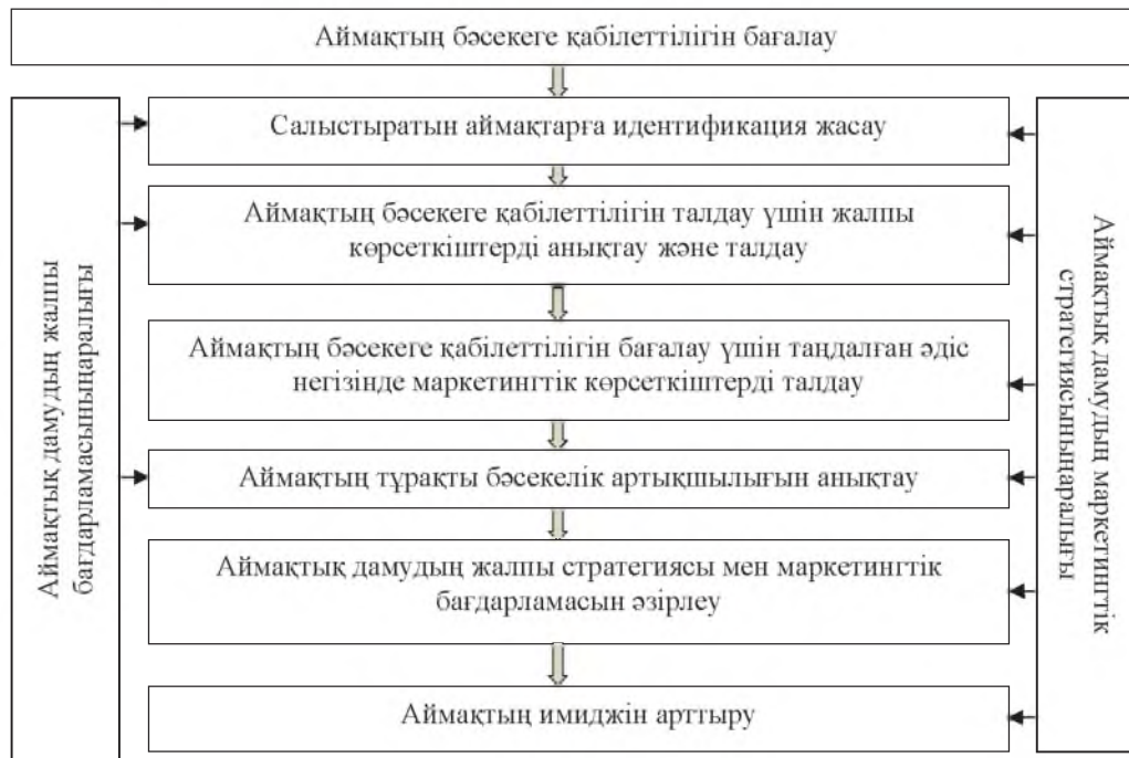
Сурет 1 – Маркетингтік талдау негізінде аймақтың бәсекеге қабілеттілігін бағалау процесі